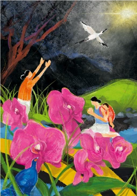
© 2021 World Day of Prayer International Committee, Inc.

Am Freitag, 03. März um 17 Uhr feiern wir den Weltgebetstags-Gottesdienst in der Marienkirche - wie gewohnt in Gemeinschaft mit den Schwestern aus der Felicianusgemeinde und der katholischen Gemeinde Heilige Familie Kirchweyhe.